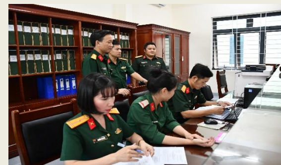
Cán bộ Văn phòng Bộ Tư lệnh Quân khu 2 kiểm tra sổ sách, văn kiện triển khai thực hiện cải cách hành chính và công tác gửi, nhận văn bản, tài liệu trên mạng.