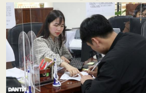
Ảnh minh họa: Hoàng Lam