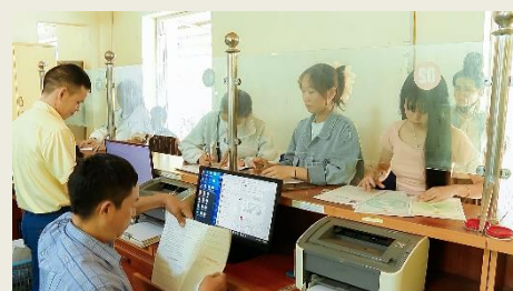
Người dân giao dịch tại Trung tâm Phục vụ hành chính công xã Nậm Cuối

Quyết tâm ổn định tổ chức bộ máy, đề ra những quyết sách đúng trọng tâm, trọng điểm để khai thác tiềm năng, lợi thế, cơ hội phát triển mới của một xã sau sáp nhập, hệ thống chính trị xã Nậm Cuối đã nỗ lực vào cuộc, triển khai đồng bộ giải pháp. Trước hết, giải quyết kịp thời những vấn đề phát sinh, bất cập của xã mới ở vùng khó; xây dựng kế hoạch, chỉ tiêu phát triển kinh tế-xã hội.