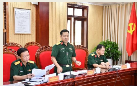
Đại biểu tham gia ý kiến tại buổi kiểm tra.

văn bản chỉ đạo của Quân uỷ Trung ương, Bộ Quốc phòng và Quân khu; ban hành các văn bản, chỉ đạo hiệu quả công tác CCHC, CDS ở Bộ CHQS tỉnh. Tiếp thu triệt để các ý kiến, kiến nghị, đề nghị, định hướng của các cơ quan chuyên môn Quân khu đã chỉ ra. Chủ động rà soát các nhiệm vụ, chỉ tiêu theo chương trình, kế hoạch, đề án đã xác định. Thống nhất quan điểm xuyên suốt, nhận thức và hành động quyết liệt trong thực hiện CCHC và CDS. Tăng cường công tác giáo dục, tuyên truyền, nâng cao nhận thức trách nhiệm của cấp uỷ, chỉ huy các cấp và người đứng đầu về công tác CCHC, CDS.