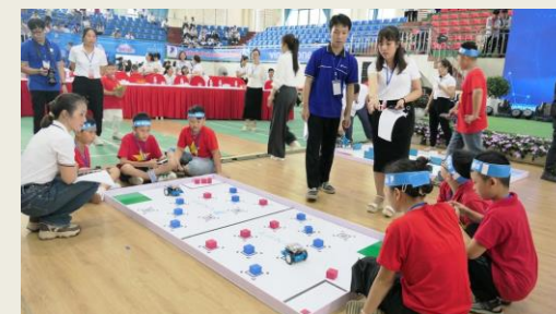
Lai Châu chú trọng phát triển nguồn lực chất lượng cao qua số hóa giáo dục.