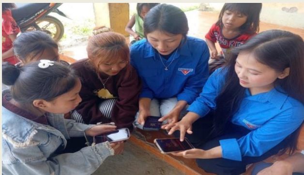
Đoàn viên xã Bum Tờ hướng dẫn người dân sử dụng dịch vụ công trực tuyến và các ứng dụng khác trên điện thoại thông minh.

Phát huy tinh thần xung kích của tuổi trẻ, Đoàn Thanh niên xã Bum Tờ không chỉ vận động, khuyến khích đoàn viên, thanh niên (ĐVTN) tiên phong chuyển đổi số (CDS) còn tích cực cùng chính quyền địa phương hỗ trợ người dân thực hiện các thủ tục hành chính (TTHC), tra cứu, đăng ký và nộp hồ sơ trực tuyến; cài đặt ứng dụng dịch vụ công, mã định danh cá nhân. Đồng thời, hướng dẫn tiếp cận công nghệ số và kỹ năng nhận diện, phòng tránh thông tin xấu độc, lừa đảo trên không gian mạng.