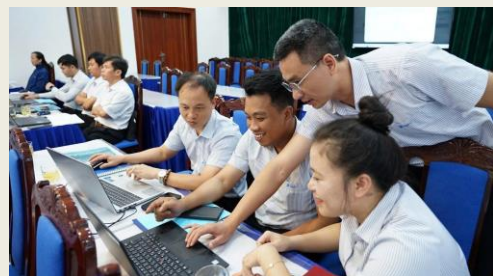
Các cơ quan, doanh nghiệp tại Lai Châu đẩy mạnh đào tạo về chuyển đổi số và trí tuệ nhân tạo (Ảnh: Cổng thông tin điện tử tỉnh Lai Châu).

Cụ thể, tỉnh quyết định giải thể toàn bộ 79 cơ quan chuyên môn cấp huyện để hình thành các cơ quan chuyên môn cấp xã/phường phù hợp với thực tiễn, hướng tới mục tiêu giảm ít nhất 30% thời gian xử lý