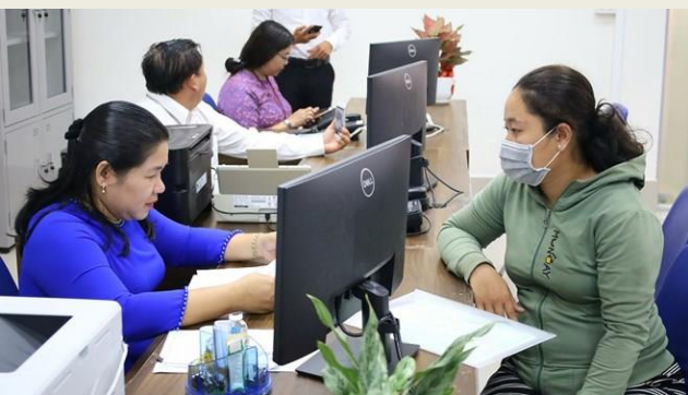
Người dân tới xin cấp phiếu lý lịch tư pháp tại TP Cần Thơ.

Dự thảo luật đề xuất người dân có quyền nộp hồ sơ yêu cầu cấp phiếu lý lịch tư pháp tại bất kỳ Công an cấp tỉnh hoặc Công an cấp xã thuận lợi nhất.