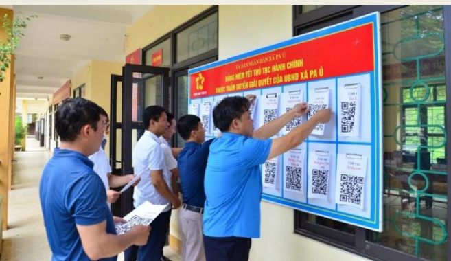
Cán bộ xã Pa Ủ triển khai niêm yết mã QR về thủ tục hành chính tại UBND xã, trụ sở được tận dụng từ trường THCS để làm việc

Công cuộc cải cách, tinh gọn bộ máy không thể thành công nếu thiếu sự gương mẫu, dám nghĩ, dám làm, dám hy sinh lợi ích cá nhân của đội ngũ cán bộ.