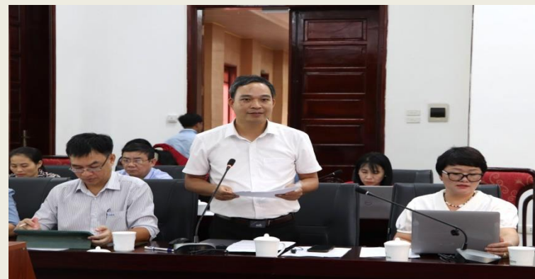
Đại diện lãnh đạo Sở Khoa học và Công nghệ báo cáo tại buổi làm việc.

Tại buổi làm việc, đại diện lãnh đạo Trung tâm Phục vụ hành chính công tỉnh đề nghị cấp có thẩm quyền xem xét, điều chỉnh đối với tiêu chí “chỉ thực hiện cung cấp dịch vụ công trực tuyến với số lượng hồ sơ trung bình của mỗi dịch vụ công phát sinh ít nhất 1.000 hồ sơ/năm/tỉnh”; đề nghị Bộ Khoa học và Công nghệ chủ trì, đánh giá tổng quan việc kết nối, chia sẻ dữ liệu Hệ thống giữa các bộ, ngành và Hệ thống thông tin giải quyết TTHC của các tỉnh để có phương án tháo gỡ các lỗi nêu trên, tạo điều kiện cho cán bộ, công chức thực hiện tiếp nhận và giải quyết TTHC đảm bảo được thông suốt, nhất là các thủ tục hành chính liên thông; Văn phòng Chính phủ đánh giá kết quả tiếp nhận và trả kết quả giải quyết hồ sơ thủ tục hành dựa trên quy định của từng TTHC.