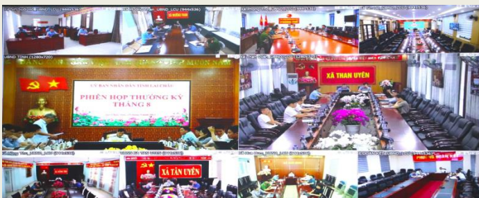
Quang cảnh tại các điểm cầu.