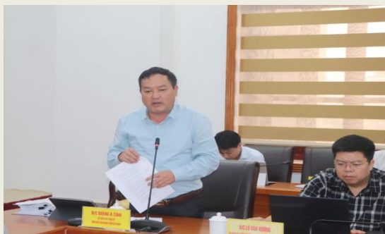
Phó Chủ tịch UBND tỉnh Giàng A Tỉnh phát biểu tại Phiên họp.