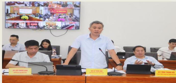
Giám đốc Sở Tài Chính báo cáo tại Phiên họp.