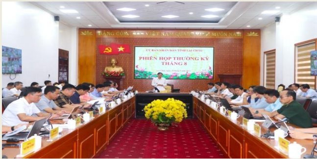
Quang cảnh Phiên họp

triển khai quyết liệt, hiệu quả các giải pháp đẩy mạnh giải ngân vốn đầu tư công năm 2025; đẩy nhanh tiến độ trồng rừng, trồng chè, cây ăn quả đảm bảo hoàn thành kế hoạch; triển khai quyết liệt, đồng bộ các giải pháp phòng, chống dịch tả lợn châu Phi trên địa bàn tỉnh.