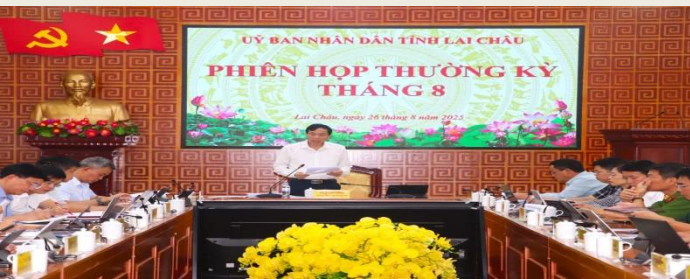
Chủ tịch UBND tỉnh Lê Văn Lương điều hành Phiên họp.