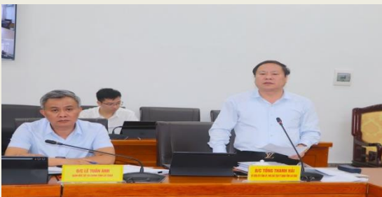
Phó Chủ tịch Thường trực UBND tỉnh Tổng Thanh Hải phát biểu tại Phiên họp.

dụng đạt 99,8%. Công tác chuẩn bị các hoạt động hướng tới chào mừng 80 năm Cách mạng tháng Tám thành công và Quốc khánh nước Cộng hòa xã hội chủ nghĩa Việt Nam được chỉ đạo sát sao.