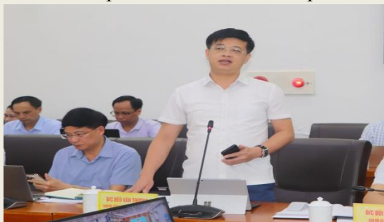
Giám đốc Sở Dân tộc Tôn giáo phát biểu tại Phiên họp.

Công tác vận hành chính quyền địa phương 2 cấp tiếp tục được triển khai đồng bộ, hiệu quả, quyết liệt, bám sát chỉ đạo của Trung ương. Công tác cải cách thủ tục hành chính gắn với thực hiện chính quyền địa phương 2 cấp tiếp tục được tăng cường. Các hoạt động khoa học, công nghệ và chuyển đổi số hướng tới thực hiện liên thông, đồng bộ, nhanh đáp ứng yêu cầu sắp xếp tổ chức bộ máy của hệ thống chính trị được triển khai quyết liệt.