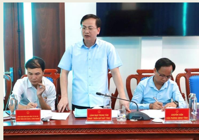
Lãnh đạo Trung tâm Phát triển quỹ đất tỉnh phát biểu tại buổi làm việc.