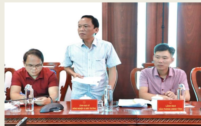
Đại diện lãnh đạo Sở Nông nghiệp và Môi trường phát biểu tại buổi làm việc.