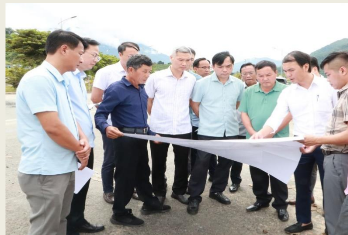
Đồng chí Giàng A Tính - Phó Chủ tịch UBND tỉnh và Đoàn công tác xem bản đồ Dự án Hạ tầng Khu trung tâm hành chính huyện Nậm Nhùn (giai đoạn III) tại thực địa.

Phát biểu kết luận buổi làm việc, đồng chí Giàng A Tính - Phó Chủ tịch UBND tỉnh đề nghị xã Nậm Hàng chủ động bám sát các quy định, cơ sở pháp lý xây dựng phương án bảng giá đất; tăng cường công tác tuyên truyền, vận động Nhân dân tạo sự đồng thuận khi Nhà nước thu hồi đất. Các sở, ngành, đơn vị có liên quan tiếp tục tăng cường công tác phối hợp, tháo gỡ khó khăn, vướng mắc trong quá trình thực hiện dự án... đảm bảo tiến độ triển khai dự án.