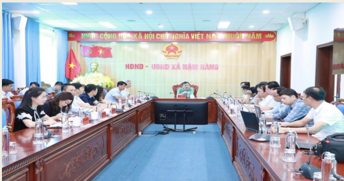
Quang cảnh buổi làm việc.