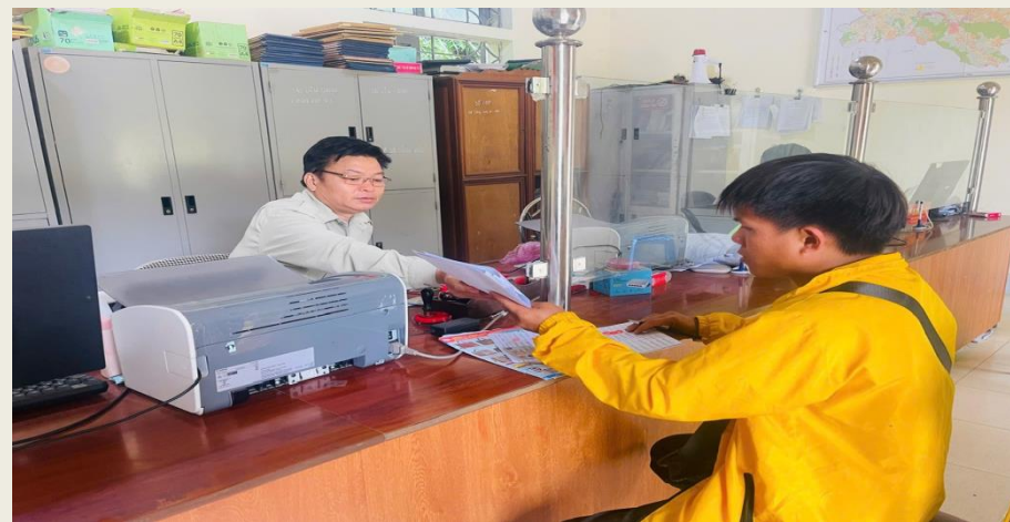
Người dân giao dịch tại bộ phận 1 cửa xã Hoang Thèn, huyện Phong Thổ

Trong cải cách thủ tục hành chính, tỉnh đã đơn giản hóa 109 thủ tục hành chính, tiết kiệm gần 23,6 tỷ đồng, cắt giảm trung bình 39,2% thời gian thực hiện thủ tục. Trên Cổng Dịch vụ công quốc gia, Lai Châu đã tích hợp đủ 344/344 dịch vụ công trực tuyến toàn trình, đạt 100% chỉ tiêu Chính phủ giao. Tỷ lệ giải quyết hồ sơ đúng hạn ở ba cấp đạt mức rất cao: cấp tỉnh 98,87%, cấp huyện 98,73%, cấp xã 98,53%. Đặc biệt, mức độ hài lòng của người dân trên toàn tỉnh đạt trung bình 94,68%, riêng ở Trung tâm phục vụ hành chính công tỉnh, 417/417 phiếu khảo sát đều đánh giá “rất hài lòng”.