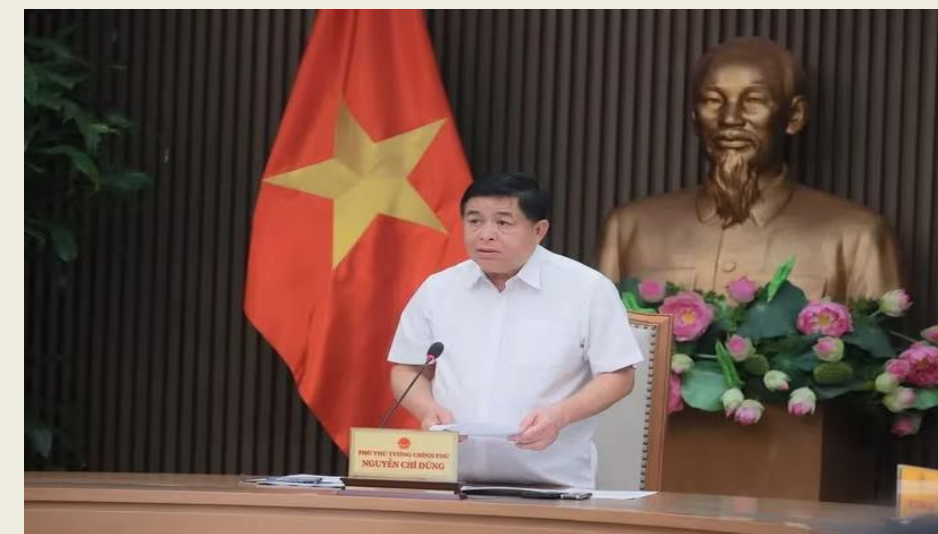
Phó Thủ tướng Nguyễn Chí Dũng giao nhiệm vụ cụ thể cho từng bộ, ngành.

BHXH Việt Nam phối hợp tích hợp và thống kê ngay các cơ sở khám chữa bệnh đã thực hiện ký số gửi về Bộ Y tế và Bộ Công an để đơn đốc thực hiện.