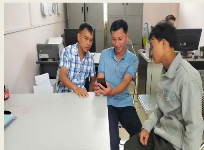
Cán bộ xã Bản Lang, huyện Phong Thổ hướng hướng dẫn người dân sử dụng các ứng dụng trên điện thoại thông minh.

Nhằm khuyến khích người dân sử dụng dịch vụ công trực tuyến, Lai Châu là một trong những địa phương đầu tiên ban hành Nghị quyết “không đồng” - miễn thu phí thực hiện TTHC trực tuyến từ ngày 1/7/2025. Đây là bước đột phá góp phần khuyến khích người dân chuyển từ phương thức truyền thống sang số hóa hồ sơ, góp phần nâng cao hiệu quả cải cách hành chính.