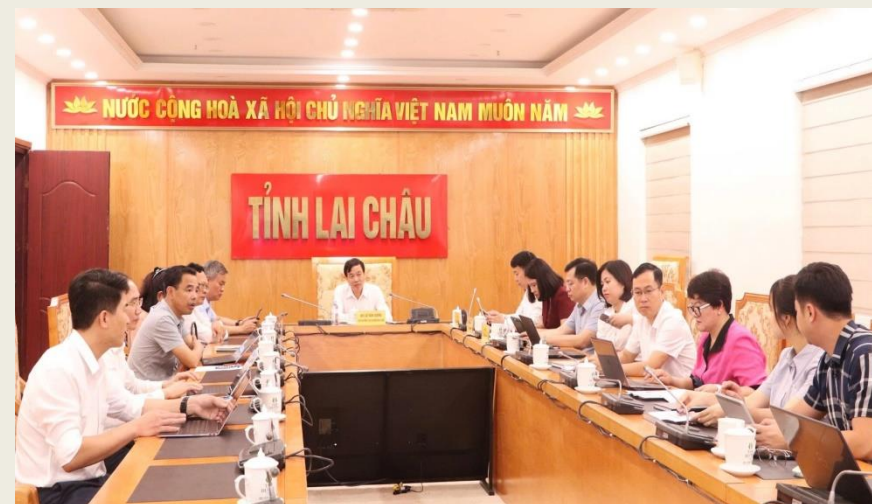
Quang cảnh cuộc họp tại điểm cầu tỉnh.