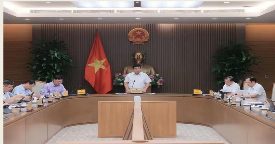
Phó Thủ tướng Nguyễn Chí Dũng nhấn mạnh không được để gián đoạn hoạt động cung cấp dịch vụ công khi triển khai chính quyền 2 cấp.

Cùng với đó, Phó Thủ tướng giao các bộ, ngành, địa phương phối hợp với các doanh nghiệp cung cấp dịch vụ bố trí đủ hạ tầng và các thiết bị đầu cuối để khai thác, vận hành các hệ thống công nghệ thông tin ổn định, thông suốt.