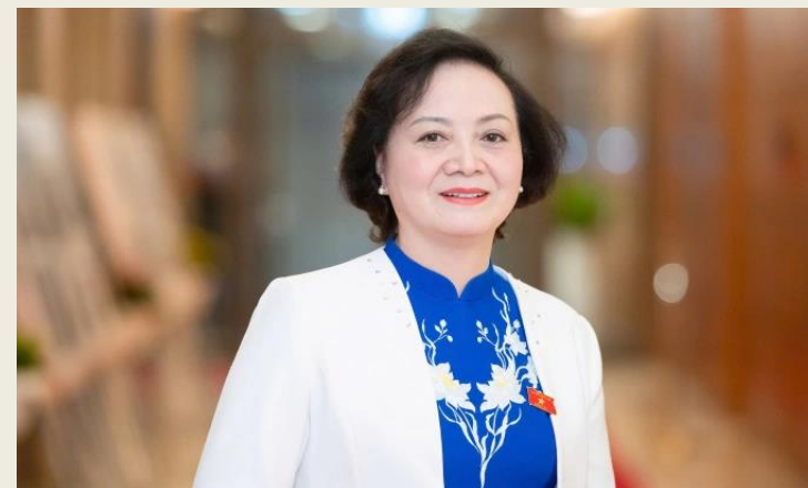
Phó thủ tướng Phạm Thị Thanh Trà.

Phó thủ tướng Phạm Thị Thanh Trà 61 tuổi, quê Nghệ An; Thạc sĩ Quản lý giáo dục, Cử nhân Sư phạm Ngữ văn; Ủy viên Trung ương Đảng khóa 12, 13; Đại biểu Quốc hội khóa 15.