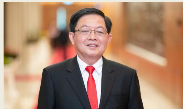
Phó thủ tướng Hồ Quốc Dũng.

Ông Dũng công tác lâu năm tại quê nhà, từng giữ các chức vụ Phó chủ tịch huyện Phù Cát; Phó chánh Văn phòng rồi Chánh văn phòng Tỉnh ủy; Phó trưởng đoàn chuyên trách Đoàn đại biểu Quốc hội tỉnh; Phó chủ tịch rồi Chủ tịch UBND tỉnh Bình Định.