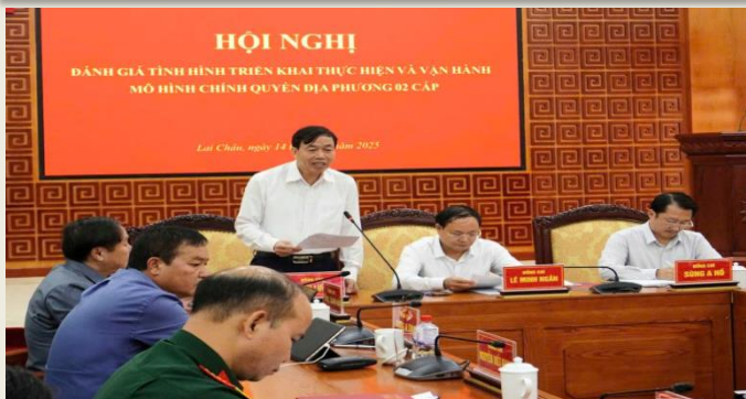
Đồng chí Lê Văn Lương - Chủ tịch UBND tỉnh điều hành nội dung thảo luận tại hội nghị.