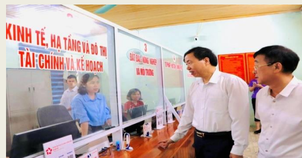
Đồng chí Lê Văn Lương - Phó Bí thư Tỉnh ủy, Chủ tịch UBND tỉnh kiểm tra tại Trung tâm Phục vụ hành chính công xã Bản Bo.

Ngày 1/7/2025, cùng với cả nước, tỉnh Lai Châu chính thức kết thúc hoạt động của đơn vị hành chính cấp huyện, vận hành mô hình chính quyền địa phương 2 cấp (cấp tỉnh và cấp xã). Đây là dấu mốc chính trị - hành chính đặc biệt quan trọng, không chỉ tác động sâu rộng đến bộ máy Nhà nước mà còn trực tiếp liên quan đến đời sống nhân dân và định hướng phát triển lâu dài của tỉnh.