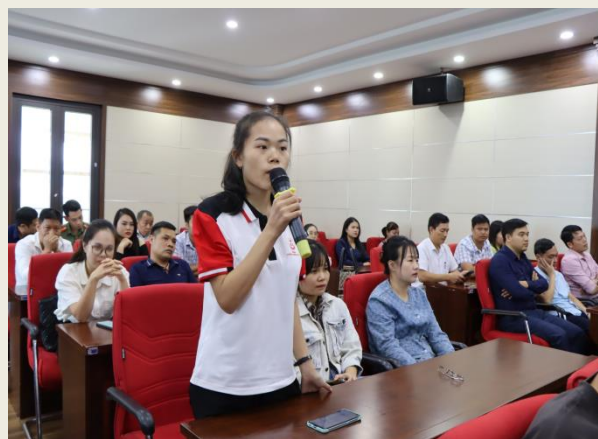
Đại biểu tham gia ý kiến tại hội nghị.