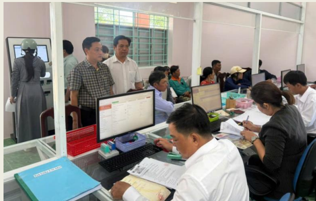
Trung tâm Phục vụ hành chính công xã Long Thạnh, tỉnh An Giang

Tuy nhiên, qua quá trình triển khai, đến nay, Bộ Nội vụ đã nhận được kiến nghị của một số địa phương về việc bổ sung, điều chỉnh một số vị trí việc làm cho phù hợp với yêu cầu thực tế trong triển khai mô hình chính quyền địa phương 2 cấp.