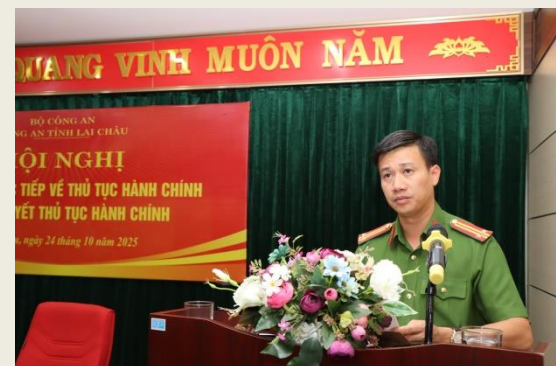
Lãnh đạo Phòng Cảnh sát Phòng cháy chữa cháy – Cứu nạn cứu hộ thông qua báo cáo kết quả giải quyết thủ tục hành chính tại hội nghị.