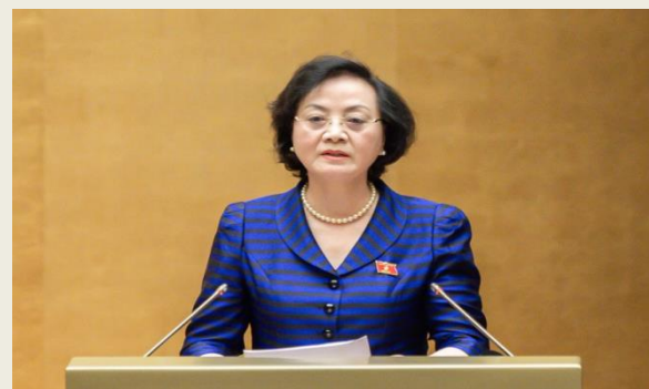
Bộ trưởng Bộ Nội vụ Phạm Thị Thanh Trà trình bày Tờ trình dự án Luật Viên chức (sửa đổi)

Dự thảo Luật Viên chức (sửa đổi) được xây dựng với nhiều điểm mới quan trọng, tập trung vào đổi mới cơ chế tuyển dụng, sử dụng và quản lý viên chức theo vị trí việc làm.