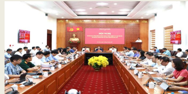
Quang cảnh hội nghị.

Theo báo cáo đánh giá kết quả hoạt động của chính quyền địa phương 02 cấp của Tỉnh ủy, từ ngày 01/7 đến ngày 10/10/2025, hoạt động của hệ thống chính trị trên địa bàn tỉnh cơ bản ổn định, thông suốt, phát huy hiệu quả bước đầu. Ban Thường vụ Tỉnh ủy đã tập trung lãnh đạo, chỉ đạo quyết liệt việc sắp xếp, kiện toàn tổ chức bộ máy các cơ quan Đảng, Nhà nước, Mặt trận Tổ quốc và các tổ chức chính trị - xã hội. Kịp thời giao 13.054 biên chế cán bộ, công chức, viên chức cấp xã sau khi thực hiện mô hình chính quyền địa phương 02 cấp.