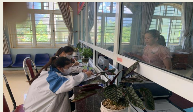
Cán bộ Bảo hiểm xã hội cơ sở Bum Tờ hướng dẫn người dân hoàn thiện thủ tục hành chính.

Bum Tờ, Mường Tè, Thu Lũm, Pa Ủ, Mù Cà, Tà Tổng) nỗ lực đẩy mạnh ứng dụng công nghệ thông tin trong hoạt động chuyên môn. Mục tiêu xuyên suốt là lấy người dân làm trung tâm phục vụ, từng bước xây dựng nền hành chính hiện đại, minh bạch, thuận tiện và hiệu quả.