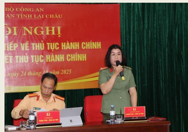
Lãnh đạo các phòng trả lời ý kiến của đại biểu.