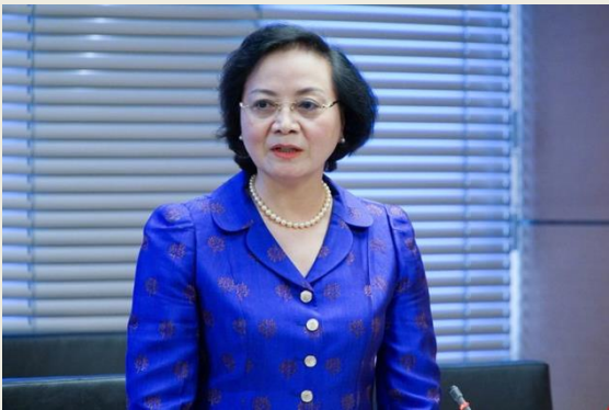
Bộ trưởng Bộ Nội vụ Phạm Thị Thanh Trà (Đoàn ĐBQH Lào Cai) phát biểu thảo luận tại tổ 4

Bộ trưởng Bộ Nội vụ Phạm Thị Thanh Trà cho biết, Bộ đang chuẩn bị cho kế hoạch rà soát, sắp xếp thôn, bản, tổ dân phố trên toàn quốc, dự kiến triển khai vào tháng 5/2026. Đây là một trong những nhiệm vụ trọng tâm nhằm hoàn thiện mô hình chính quyền địa phương hai cấp.