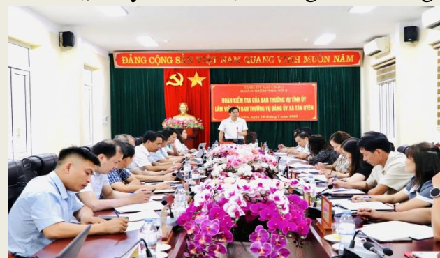
Đồng chí Lê Văn Lương - Phó Bí thư Tỉnh uỷ, Chủ tịch UBND tỉnh và Đoàn công tác làm việc với xã Tân Uyên về vận hành mô hình chính quyền địa phương 2 cấp.

Song song với công tác nhân sự, Lai Châu đặc biệt chú trọng sắp xếp trụ sở làm việc, cơ sở vật chất và phương tiện kỹ thuật. Toàn tỉnh đã rà soát gần 2.000 cơ sở nhà đất, điều hòa phù hợp 82 trụ sở giữa các đơn vị; phân bổ hợp lý, tiết kiệm, tránh lãng phí. Các trang thiết bị, máy móc được bàn giao theo nguyên tắc “nhiệm vụ đi đến đâu, tài sản đi đến đó”, hạn chế tối đa việc mua sắm mới.