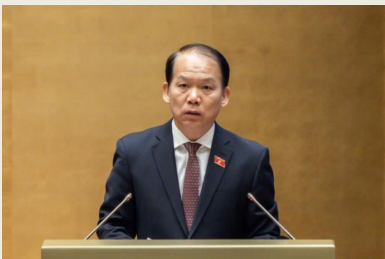
Chủ nhiệm Ủy ban Pháp luật và Tư pháp của Quốc hội Hoàng Thanh Tùng trình bày báo cáo thẩm tra dự án Luật Viên chức (sửa đổi)

Đồng thời, dự thảo khuyến khích ứng dụng công nghệ số, xây dựng cơ sở dữ liệu quốc gia về viên chức, bảo đảm công khai, minh bạch trong quản lý, đánh giá và phát triển đội ngũ. Trên cơ sở đó, cơ quan quản lý sẽ thực hiện cơ chế sàng lọc đối với những viên chức không đáp ứng được yêu cầu nhiệm vụ, góp phần nâng cao hiệu lực, hiệu quả hoạt động của đơn vị sự nghiệp công lập.