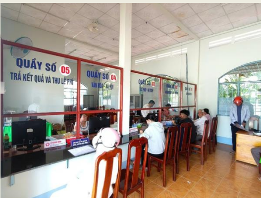
Người dân thực hiện thủ tục tại Trung tâm Phục vụ hành chính công xã Trung Hiệp, tỉnh Vĩnh Long

Ủy ban nhân dân cấp xã quyết định thành lập theo thẩm quyền 01 đơn vị sự nghiệp công lập cung ứng dịch vụ sự nghiệp công cơ bản, thiết yếu đa ngành, đa lĩnh vực (gồm: văn hóa, thể thao, du lịch, thông tin, truyền thông, môi trường, khuyến nông, đô thị...) do ngân sách nhà nước bảo đảm.