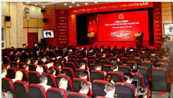
Chương trình Chào mừng Ngày Chuyển đổi số Quốc gia năm 2025

Đặc biệt, thể chế và chính sách về chuyển đổi số ngày càng hoàn thiện – từ Nghị quyết số 57-NQ/TW của Bộ Chính trị đến các chương trình, kế hoạch hành động của Chính phủ, bộ, ngành, địa phương, tạo hành lang pháp lý đồng bộ cho quá trình số hóa toàn diện.