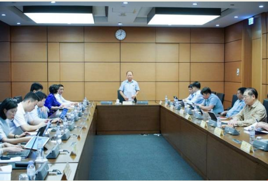
Các đại biểu thảo luận tại tổ 4

Bên cạnh đó, Bộ trưởng cho biết, về thủ tục hành chính, cơ sở vật chất khi thực hiện mô hình chính quyền hai cấp vẫn còn có những khó khăn nhất định.